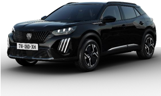
Perla Nera black